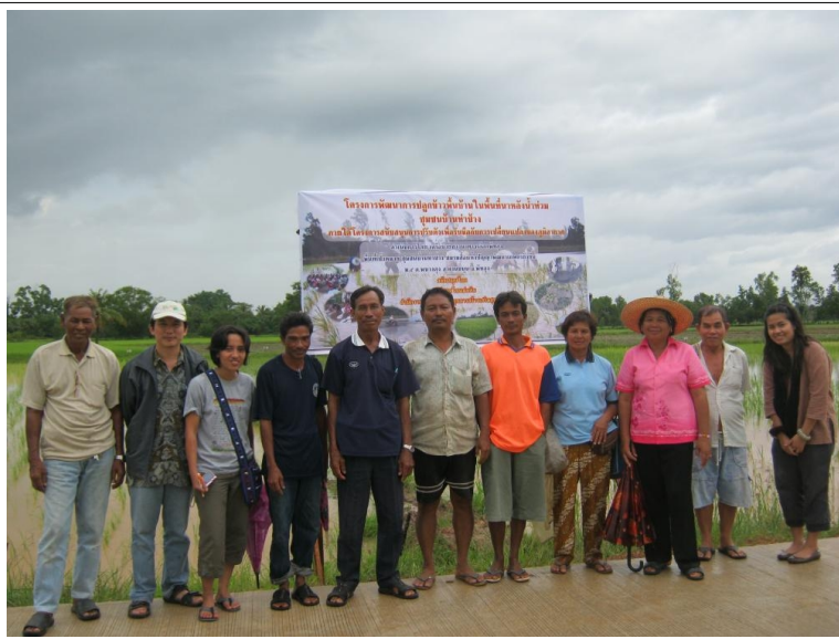
เกษตรกรสมาชิกวิทยาลัยรวงข้าว และเจ้าหน้าที่เครือข่ายเกษตรทางเลือกภาคใต้

ติดต่อ เครือข่ายชาวนาทางเลือกพัทลุง 291 หมู่ 5 ตำบลพนาสูง อำเภอดวนขุน จังหวัดพัทลุง โครงการนำร่องการปรับตัว เพื่อรับมือกับการเปลี่ยนแปลงของภูมิอากาศ มูลนิธิสายใยแผ่นดิน