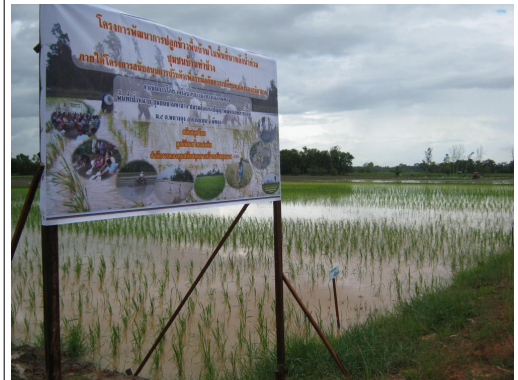
แปลงทดลองปลูกข้าวพื้นบ้าน ในโครงการ